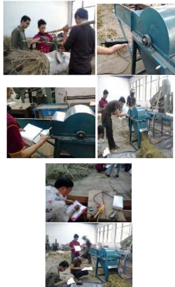
Gambar 6. Proses pengujian mesin pencacah rumput gajah

Tetapi panjang potongan dari rumput gajah masih jauh dari harapan lebih dari 4 cm dan hasil potongannya tidak seragam. Hal ini dikarenakan sudut pemotongan dari pisau pemotong tidak seragam, jarak antara pisau yang bergerak dengan pisau diam kurang rapat sekitar 1 – 2 mm.