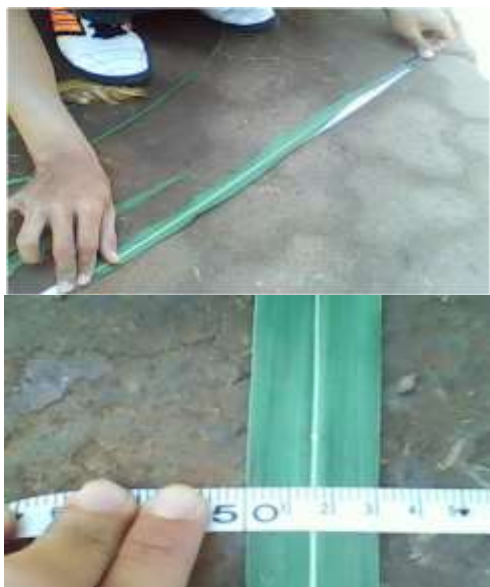
Gambar 2. Pengukuran karakteristik fisik rumput gajah

Pengukuran karakteristik rumput gajah telah dilakukan di laboratorium Alat dan Mesin Pertanian, Fakultas Teknologi Industri Pertanian Unpad seperti yang disajikan pada Gambar 2.