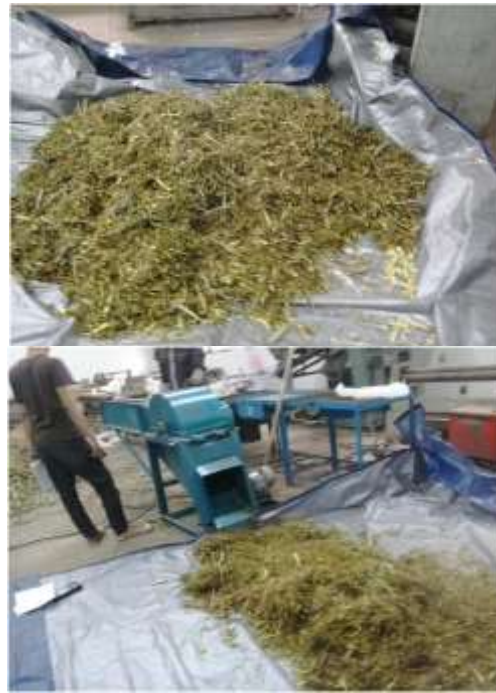
Gambar 7. Hasil pemotongan rumput gajah

Jika dilihat secara keseluruhan terhadap hasil pemotongan rumput gajah. Maka terlihat bahwa pemotongan terhadap rumput gajah dengan menggunakan mesin pencacah rumput gajah tipe reel mendapatkan hasil potongan yang cukup rapih dan seragam. Adapun beberapa daun yang tidak tercacah dikarenakan daun tersebut berbentuk pipih dan biasanya melilit pada silinder pencacah. Hasil cacahan rumput gajah pada mesin pencacah dapat dilihat pada Gambar 7.