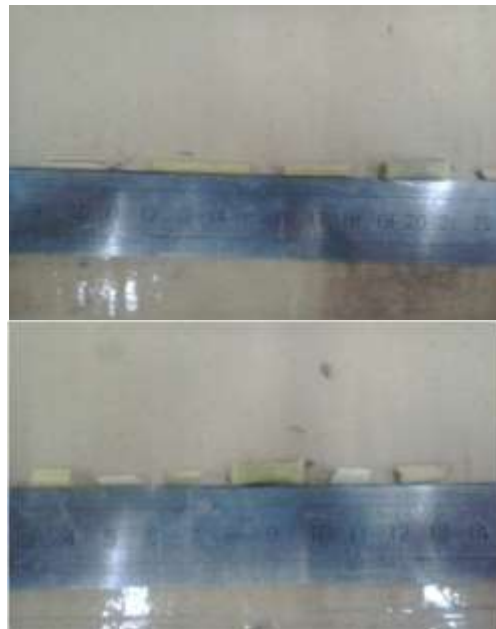
Gambar 8. Panjang potongan rumput gajah

Adapun hasil pemotongan serasah setelah posisi pisau diperbaiki yaitu berkisar antara 1 - 3 cm mendekati perhitungan secara teoritis seperti yang terlihat pada Gambar 8.