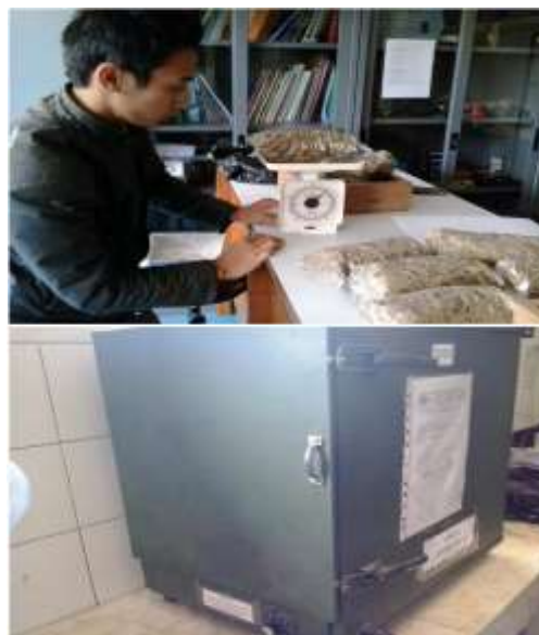
Gambar 4. Pengukuran kadar air

Hasil pengukuran (Gambar 4) dan perhitungan mengenai kadar air serasah tebu pada basis kering menunjukkan bahwa rata-rata kadar rumput gajah adalah 81,1%, dengan pengaturan suhu 110^\circ\text{C} , selama 2x24 jam.