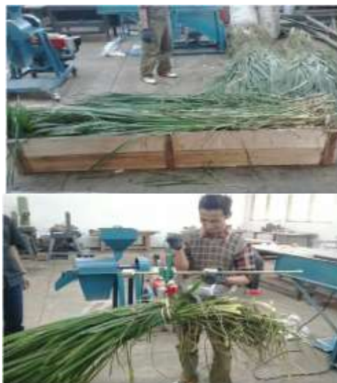
Gambar 3. Pengukuran bulk density

Pengukuran kerapatan isi ( bulk density ) rumput gajah dilakukan Laboratorium Alat dan Mesin Pertanian dengan bantuan bak kayu sebagai volume seperti yang disajikan pada Gambar 3.