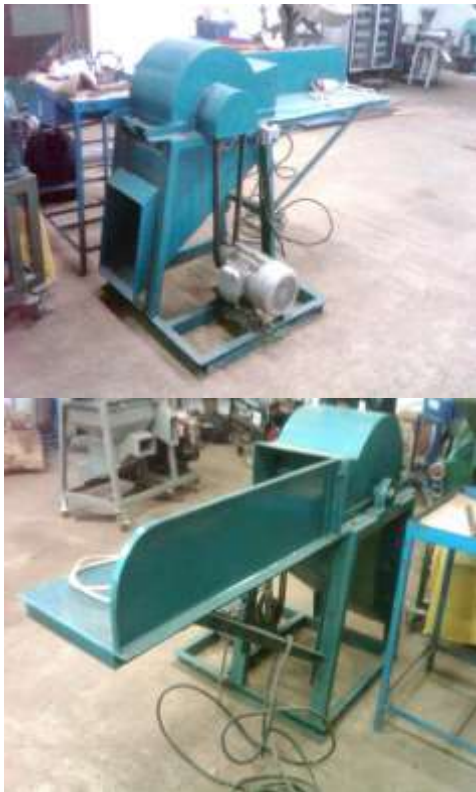
Gambar 5. Prototipe mesin pencacah rumput gajah dengan menggunakan pisau tipe reel

didasarkan pada gambar kerja hasil rancangan. Adapun proses pembuatan dimulai dari pembuatan hopper, pembuatan rangka, silinder pencacah, sistim transmisi, dan lubang pengeluaran. Dengan mengikuti kaidah-kaidah dalam mendisain suatu mesin, khususnya mesin-mesin pertanian pada akhirnya desain mesin pencacah rumput gajah dapat di pabrikan. Secara struktural mesin pencacah rumput gajah tebu dapat dilihat pada Gambar 5.